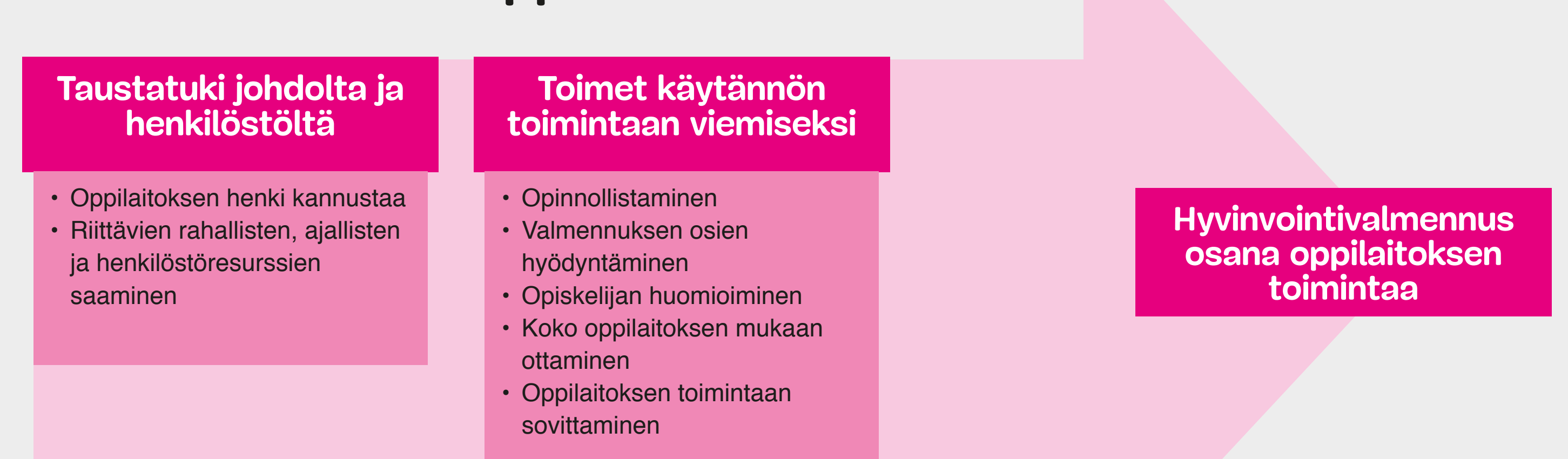
Kuvio 3. Valmennuksen vieminen osaksi oppilaitoksen toimintaa